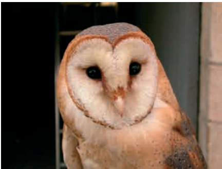
L'Effraie des clochers, une chouette familière de notre région